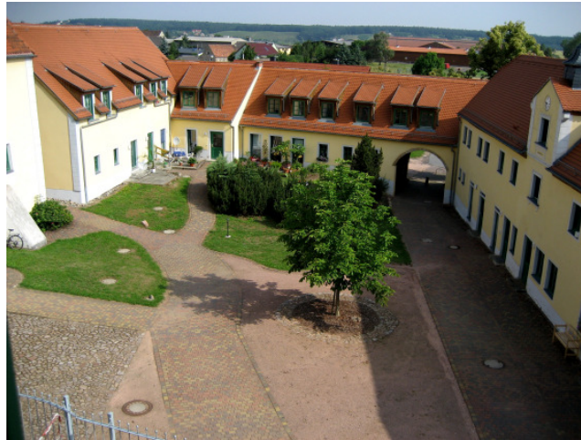
Blick aus der Wohnung