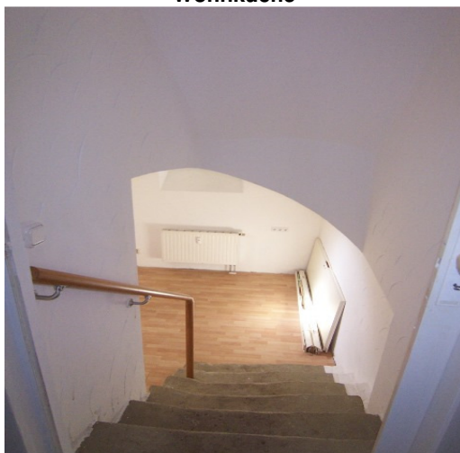
Zugang zum künftigen